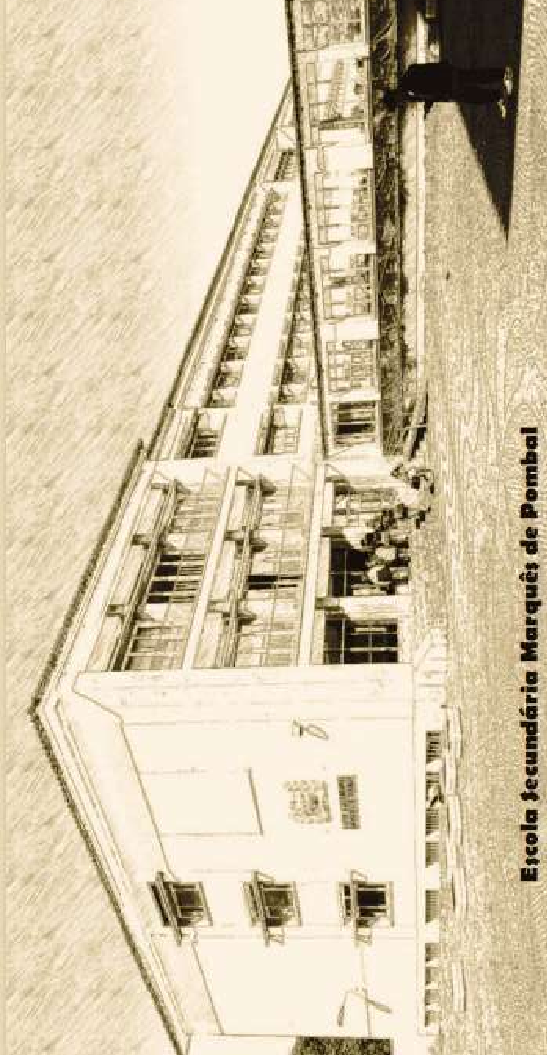
Escola Secundária Marquês de Pombal